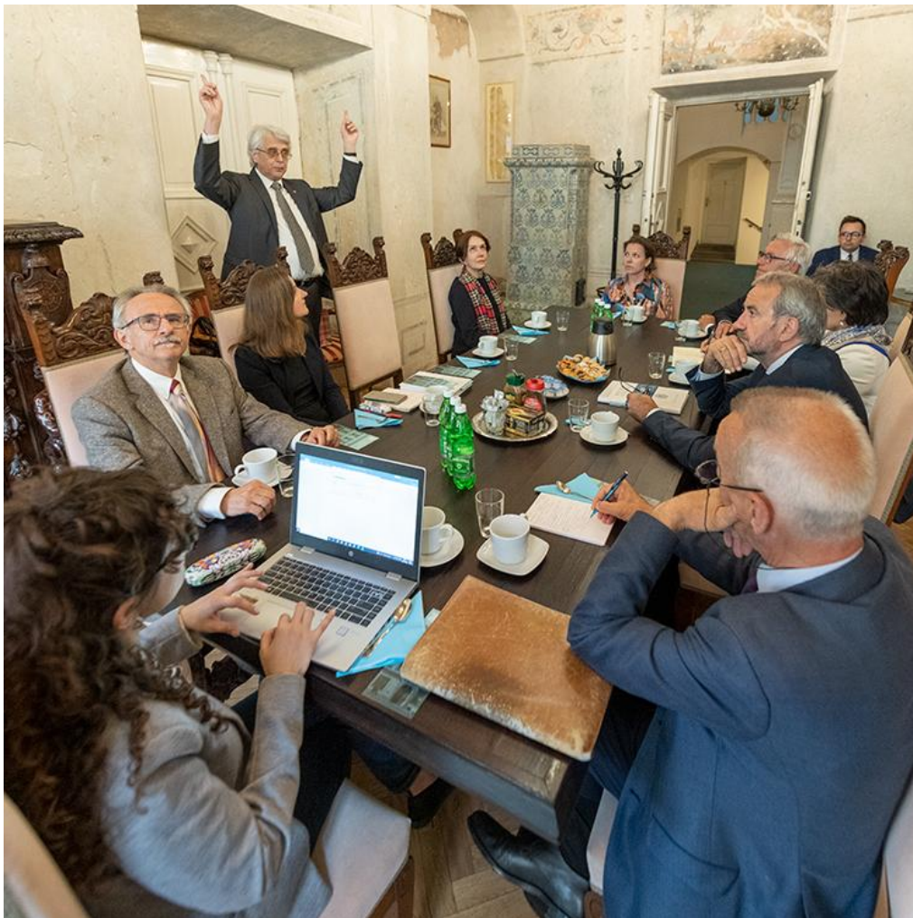
Wizyta Zarządu i Rady Europa Nostra w Towarzystwie Miłośników Historii i Zabytków Krakowa, 9 maja 2022 roku

Wydarzenie było częścią programu jubileusz 45-lecia wpisania historycznego centrum Krakowa na Listę światowego dziedzictwa UNESCO.